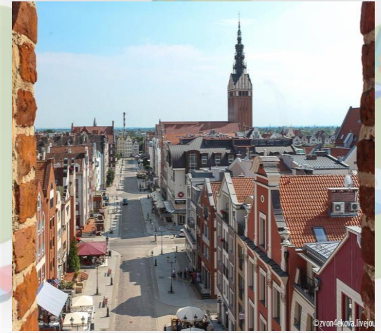
м. Ельблонг, центр Ельблонгського кластера