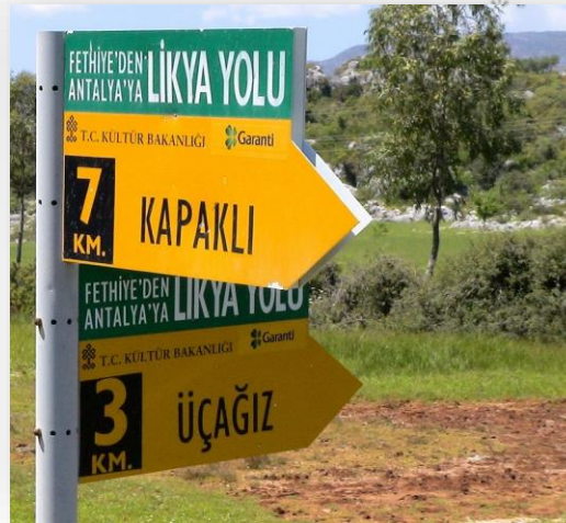
Вказівники на Лікійській стежці