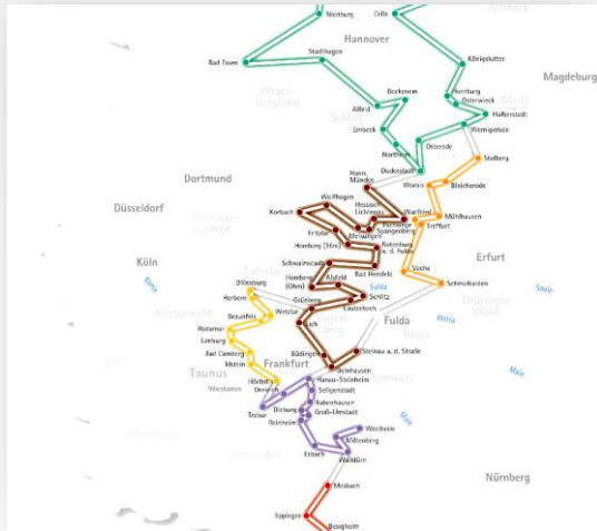
Тематичний маршрут “Дорога фахверків”